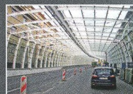
Protihluková stěna - II. etapa, Hradec Králové