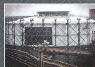
Rekonverze plynojemu, Ostrava - Vítkovice