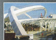
Stanice metra Strážkov, Praha