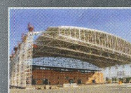
Hangár, letiště Ostrava - Mošnov