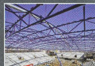
Zimní stadion, Chomutov