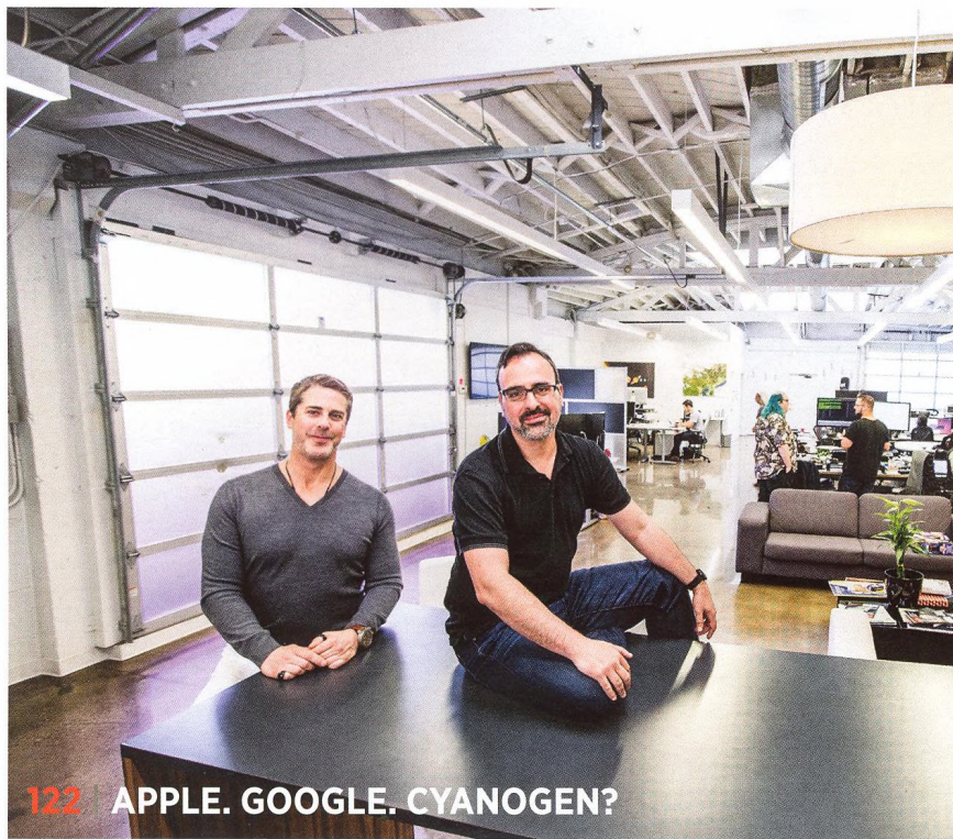
122 | APPLE. GOOGLE. CYANOGEN?