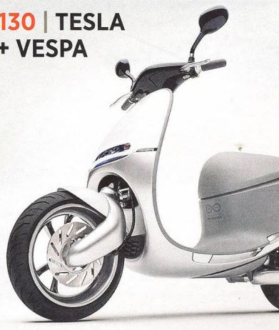
130 | TESLA + VESPA