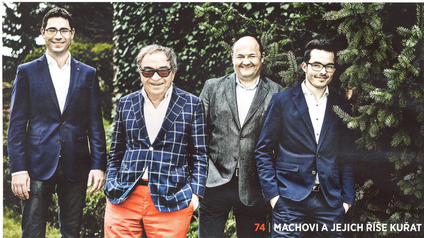
74 | MACHOVI A JEJICH ŘÍŠE KUŘAT