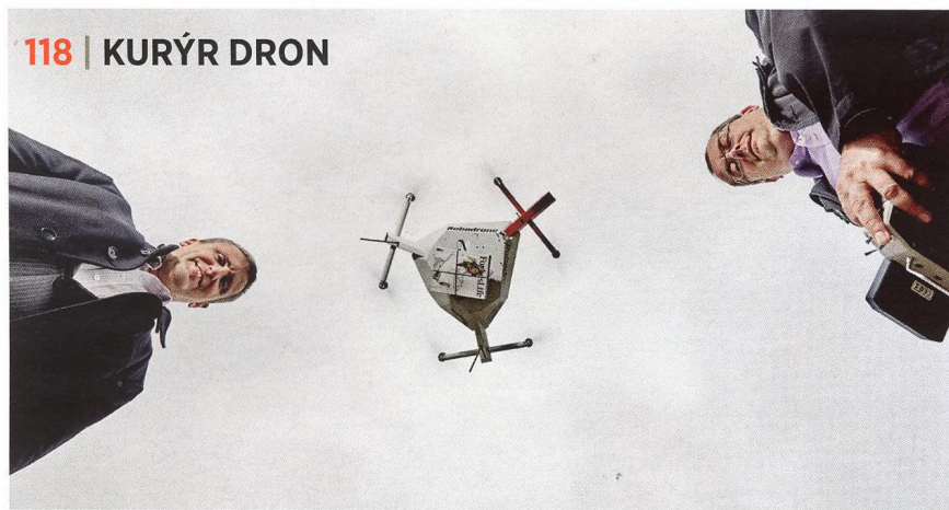
118 | KURÝR DRON