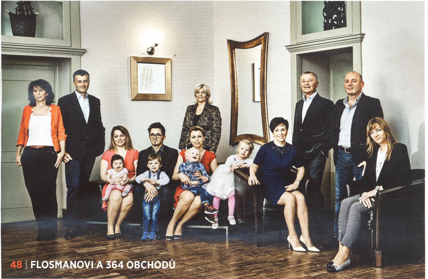
48 | FLOSMANOVI A 364 OBCHODŮ