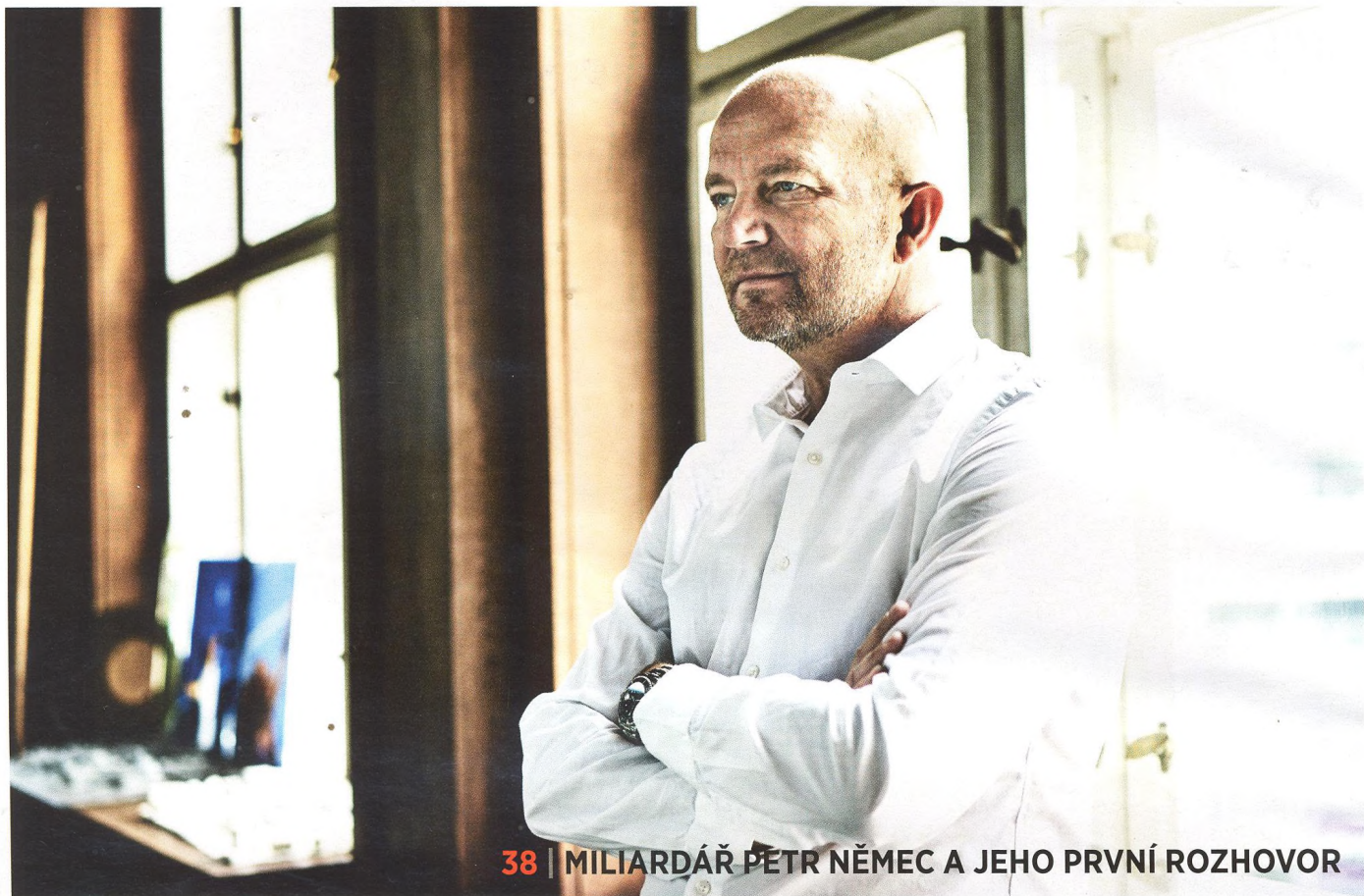
38 | MILIARDÁŘ PETR NĚMEC A JEHO PRVNÍ ROZHOVOR