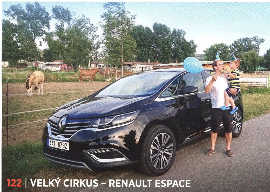
122 | VELKÝ CIRKUS – RENAULT ESPACE