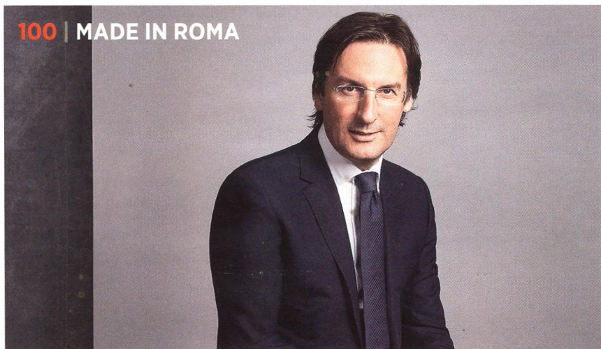
100 | MADE IN ROMA