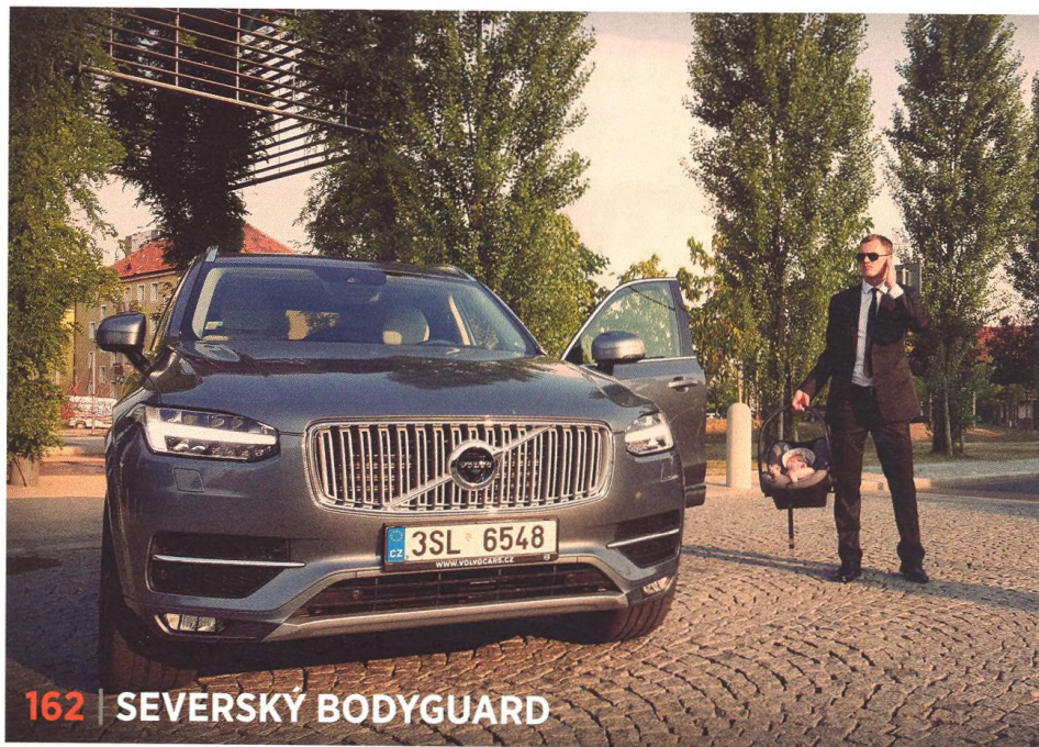
162 | SEVERSKÝ BODYGUARD