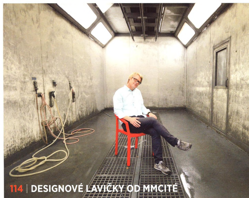
114 | DESIGNOVÉ LAVIČKY OD MMCITĚ