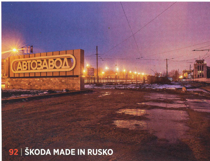
92 | ŠKODA MADE IN RUSKO