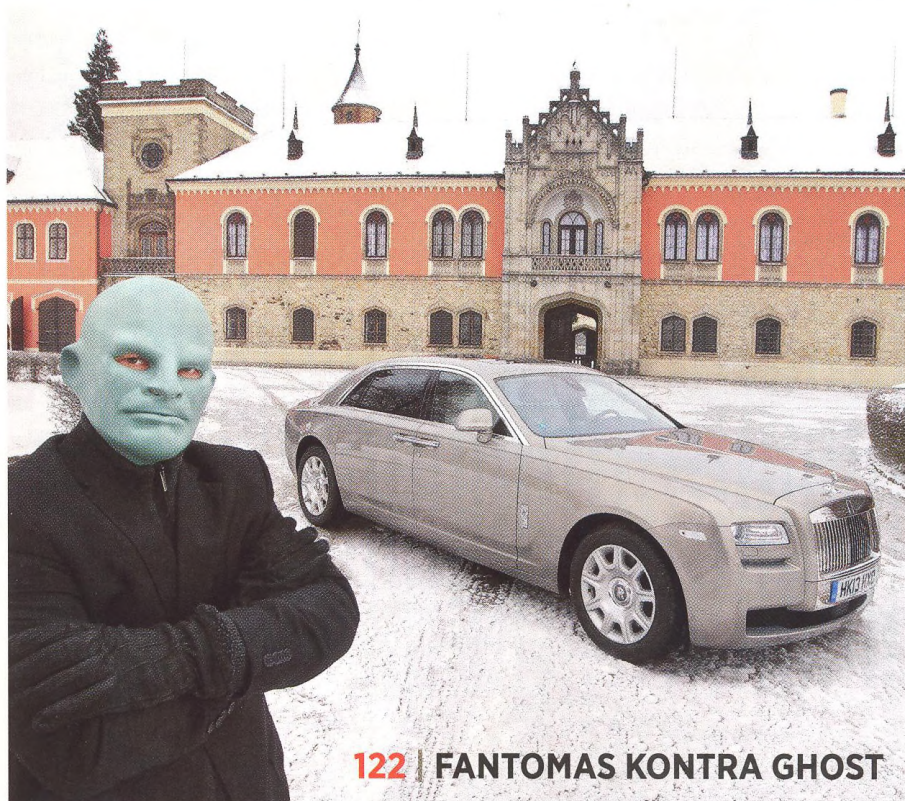
122 | FANTOMAS KONTRA GHOST