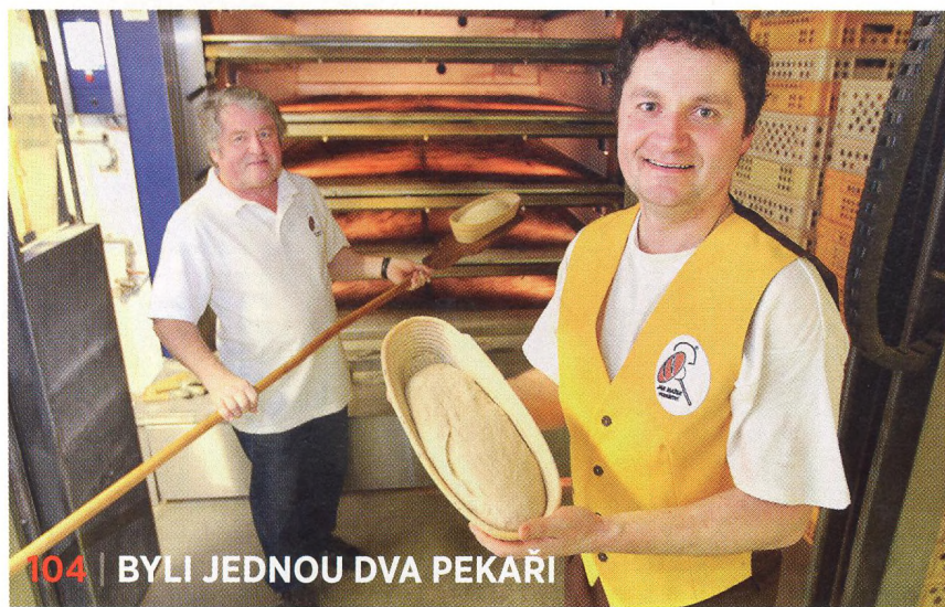
104 | BYLI JEDNOU DVA PEKAŘI