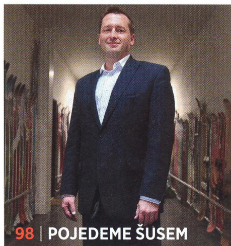
98 | POJEDEME ŠUSEM