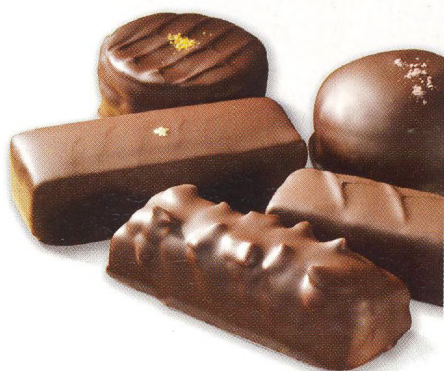
126 | SLADKÁ TEČKA