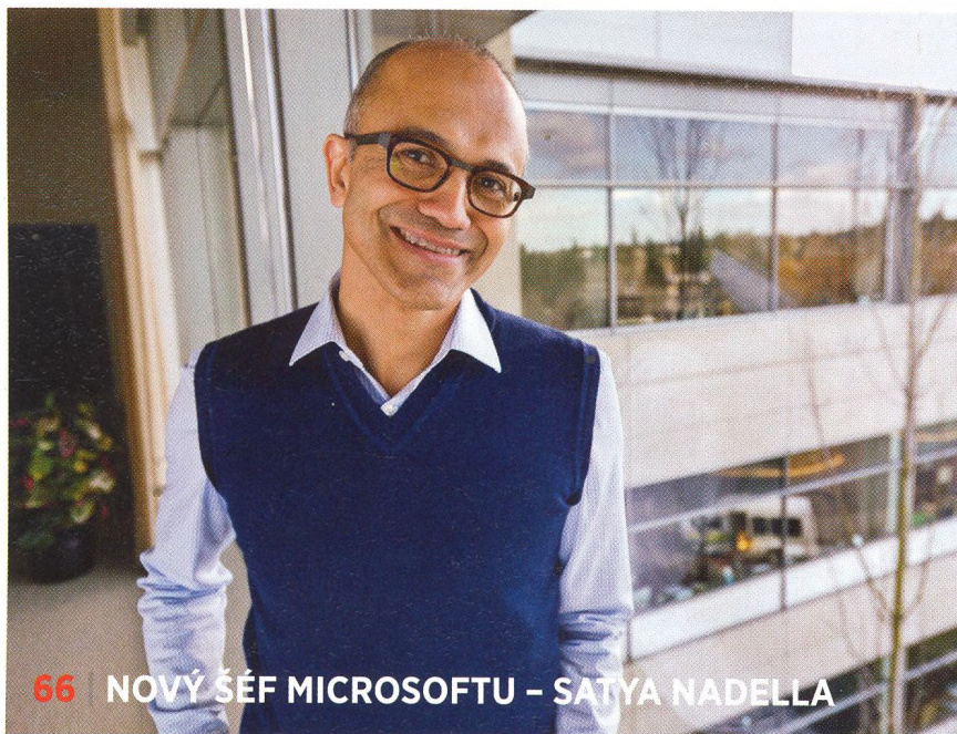
66 | NOVÝ ŠÉF MICROSOFTU – SATYA NADELLA