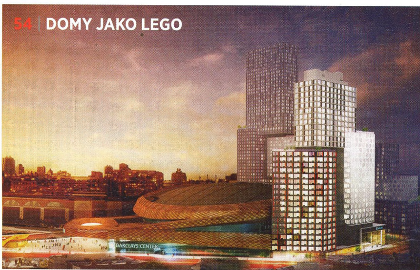
54 | DOMY JAKO LEGO