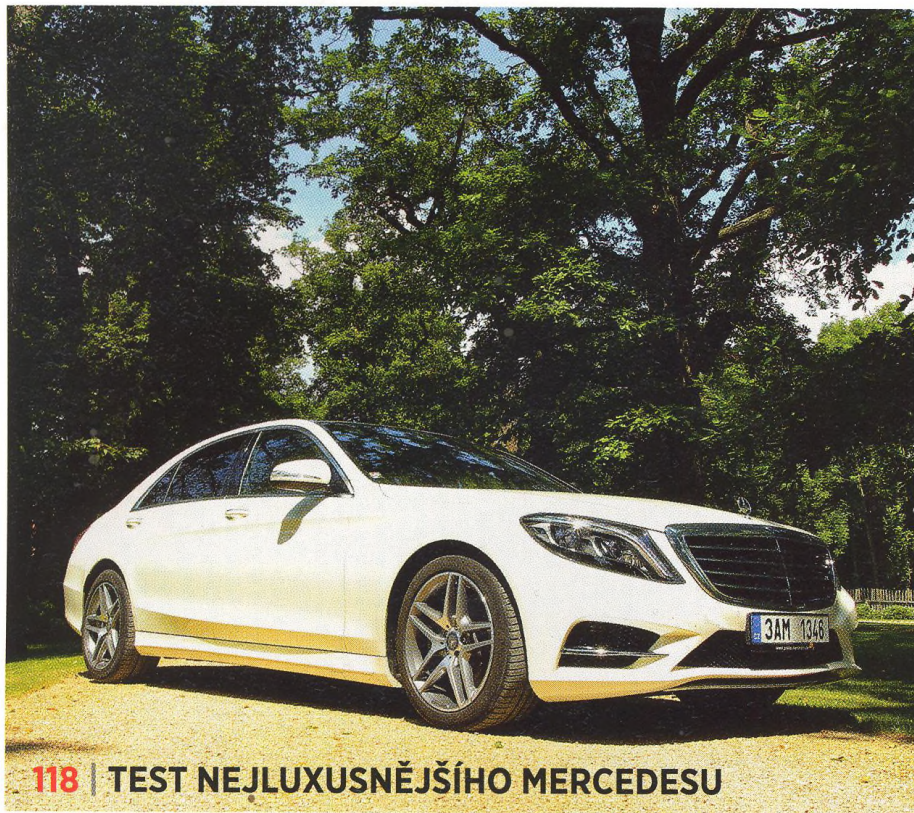
118 | TEST NEJLUXUSNĚJŠÍHO MERCEDESU