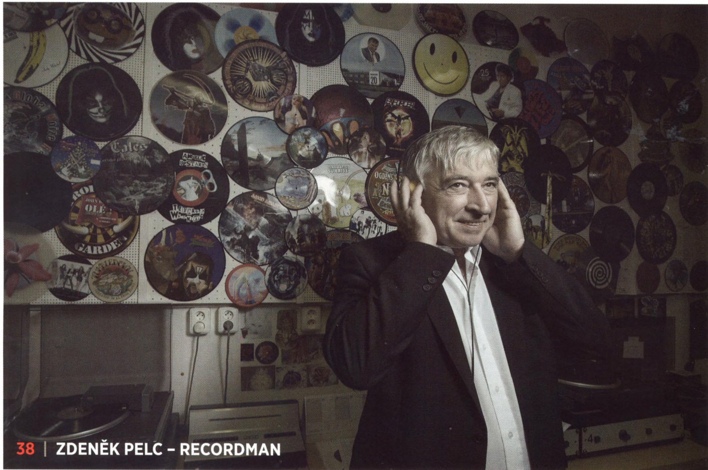
38 | ZDENĚK PELC – RECORDMAN