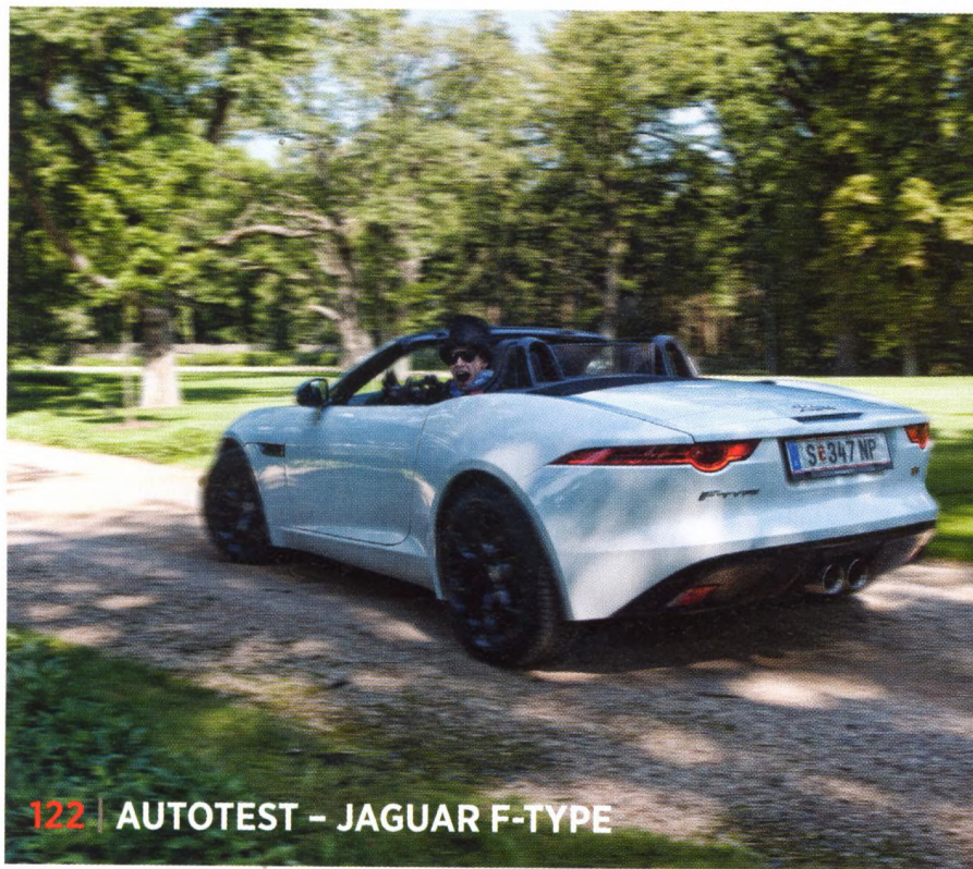
122 | AUTOTEST – JAGUAR F-TYPE