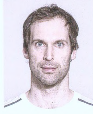
188 Petr Čech: Nová zlatá generace