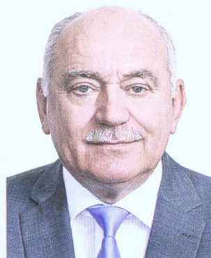
122 Zbyněk Frolík: Technologický pokrok, ostrý boj a evropské překážky