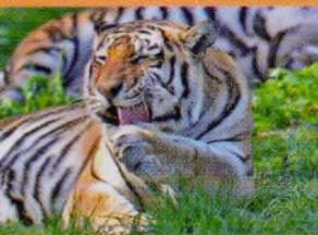
ŽOO Tábor, str. 38