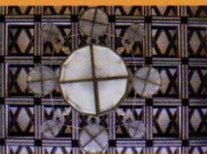
Wenkeův dům, str. 20