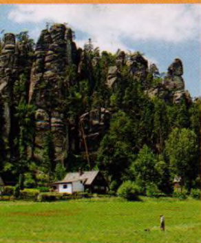
Titul: Skupina Království na okraji Adršpašských skal, str. 43