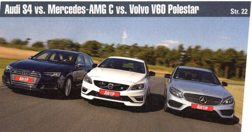
Audi S4 vs. Mercedes-AMG C vs. Volvo V60 Polestar