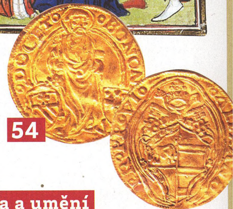
» Dukát Alexandra VI.