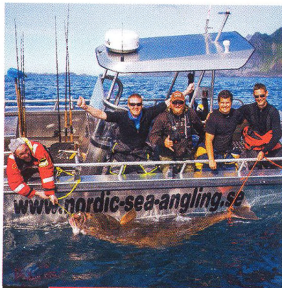
28 Největší halibut „caught and released“!