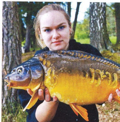
22 Kapři z mělčín