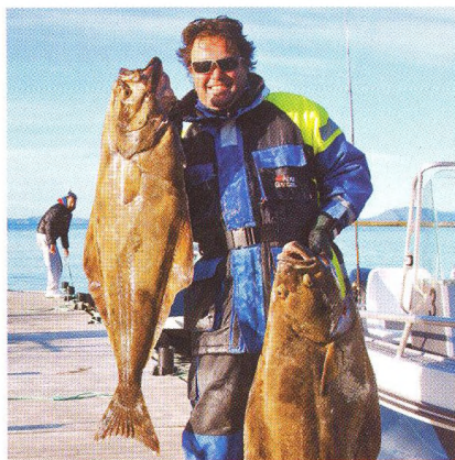
06 Loppa – Nuvsvåg