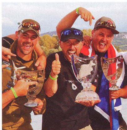
28 Češi ovládli World Carp Classic 2016