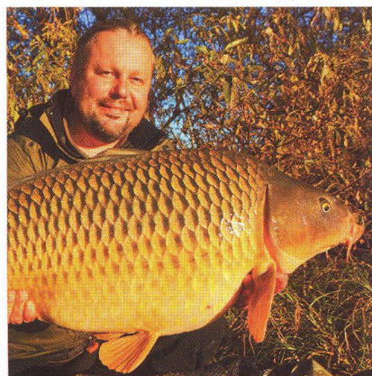
20 Jak to chodí na rybářské výpravě