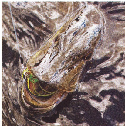
14 Helesjö – na skok ve štičím království