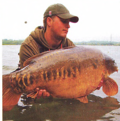
30 Lov kaprů na velkých šterkopískovnách