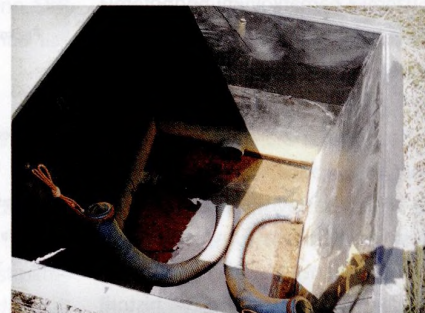
Foto na titulní straně Daniela Uřešová, za umožnění pořízení fotografie děkujeme AIG/LINCOLN CZ s. r. o.