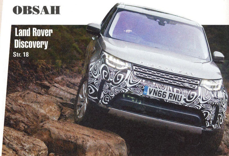
Land Rover Discovery