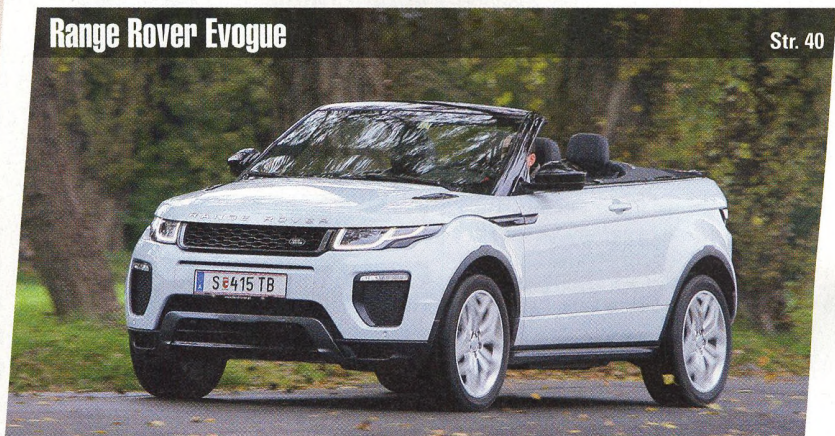
Range Rover Evogue