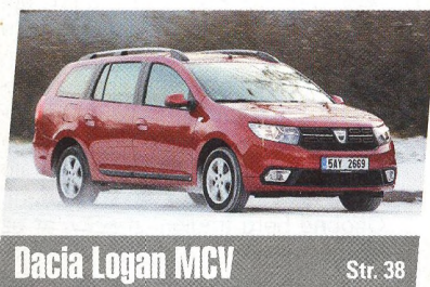
Dacia Logan MCV