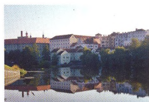
36 CYKLOTOULKY Kolem Žamberka a Písku