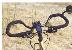
58 „ALTERNATIVNÍ“ ŘÍDÍTKA Chyť se a nepuště!