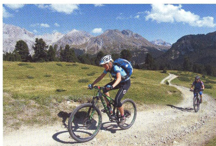
30 ZAHRA NIČNÍ REGION Val Müstair – utajený švýcarský klenot