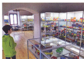
52 MALÝ VÝLET S DĚTMI Vysočinou kolem Brtnice