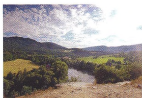
44 JINÉ KONČINY NAŠÍ KRAJINY Vysídlený kraj kolem Doupova