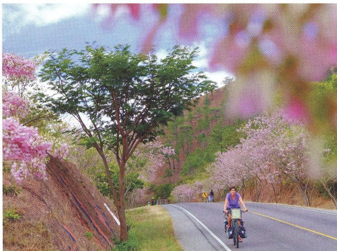
18 VELKÁ CESTA Přátelská, vlídná a barevná Nikaragua