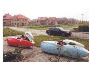
62 Z JINÉHO POHLEDU Život s velomobilem