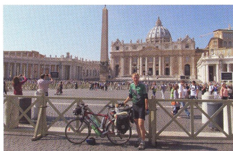
26 ROZHOVOR Cyklistická koruna Evropy