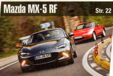
Mazda MX-5 RF