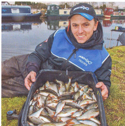
24 Konopí / rostlina mnoha hezkých chvil