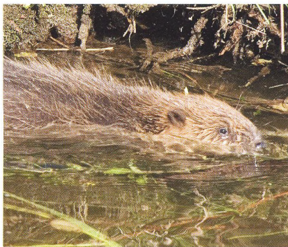
18 Bobr a Šumava?!