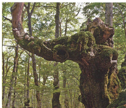
18 V nejstarším národním parku Itálie