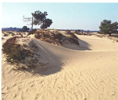
26 Do přírody Nizozemí