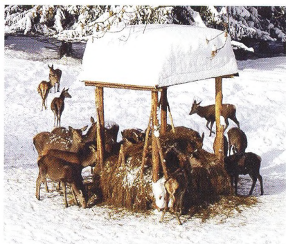
08 Přezimovací obůrky v NP Šumava