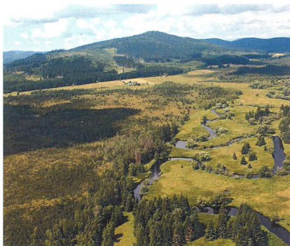
24 Teplá Vltava