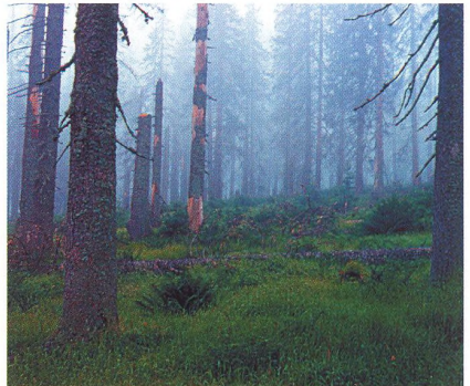
30 Šumavský poutník II.