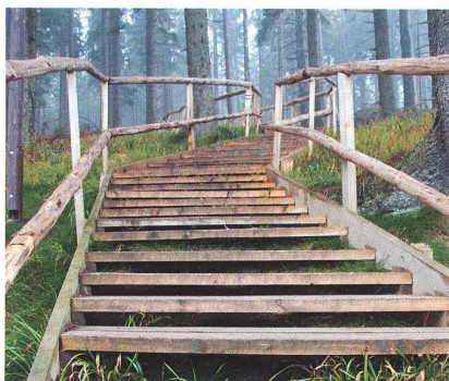
24 Sešlap půdy Boubínu neprospívá