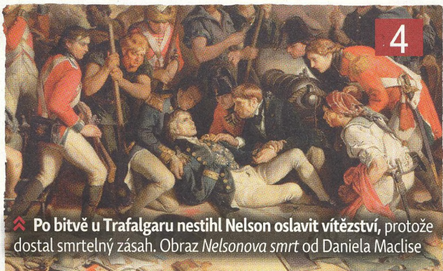
⚡ Po bitvě u Trafalgaru nestihl Nelson oslavit vítězství, protože dostal smrtelný zásah. Obraz Nelsonova smrt od Daniela Maclise