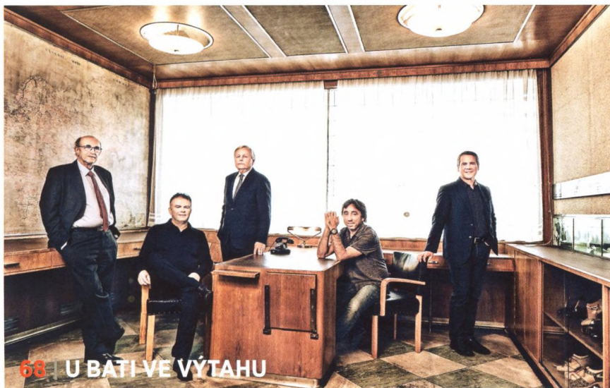
68 | U BAŤI VE VÝTAHU