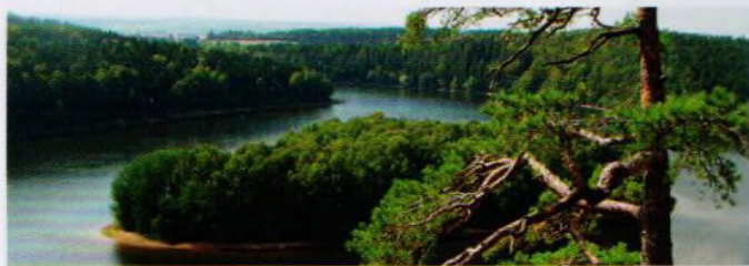
Romantická scenerie nad nádrží Seč