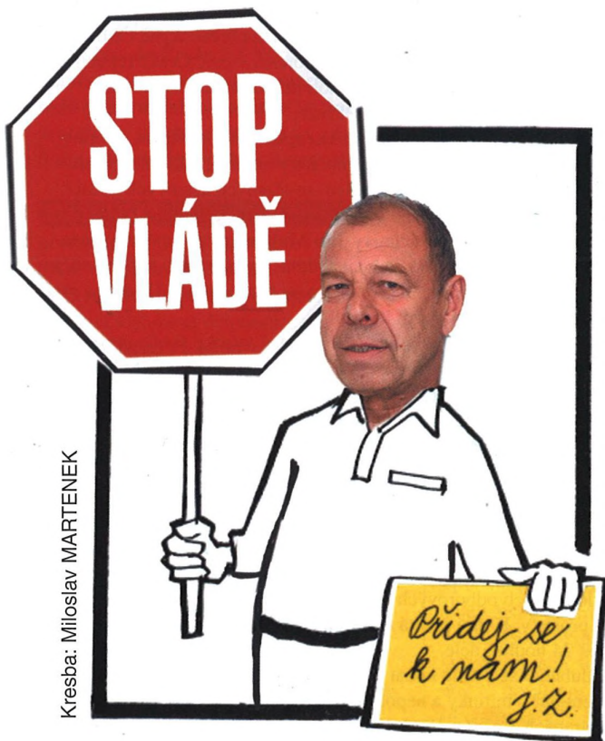
Kresba: Miloslav MARTENEK