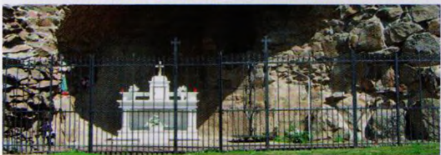
Na bohutické křížové cestě uvidíte i Lurdskou jeskyni