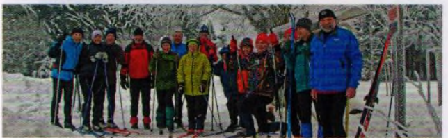
Letos se Ještědský hřeben přejížděl po padesáté