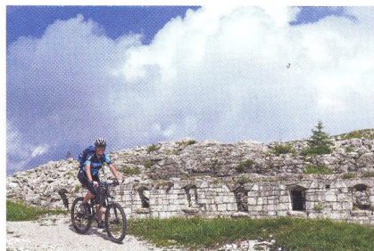
38 ZAHRANIČNÍ REGION Italské Alpe Cimbra – dějiny a relikty 1. světové války na dosah