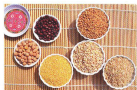
66 SPRÁVNÁ VÝŽIVA – SKRYTÝ MOTOR NA KOLE Alternativní výživové směry, pro a proti