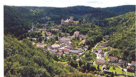
46 CYKLOTOULKY Kolem Kašperských Hor a Znojma