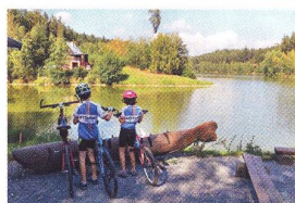
64 MALÝ VÝLET S DĚTMI Do Kralic nad Oslavou