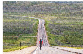
70 Z JINÉHO POHLEDU Trans Am – jiná dimenze cykloturistiky