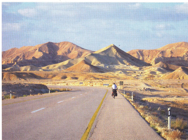
20 VELKÁ CESTA Izrael a Palestina – svatou zemí všemi směry