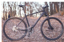
76 CELÝ MĚSÍC V MĚSTSKÉM PROVOZU Winora Alamos na městskou dlažbu i lesní výlet