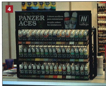
4 Vallejo předvedlo celou řadu novinek