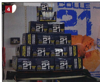
4 Colle 21 je známý výrobce vteřinových lepidel