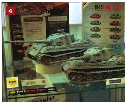
4 Ammo přebalí Tiger II firmy Takom 1:35