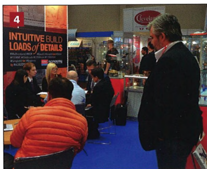
4 Čekání... Pán v oranžové bundě patřil k expozici Academy