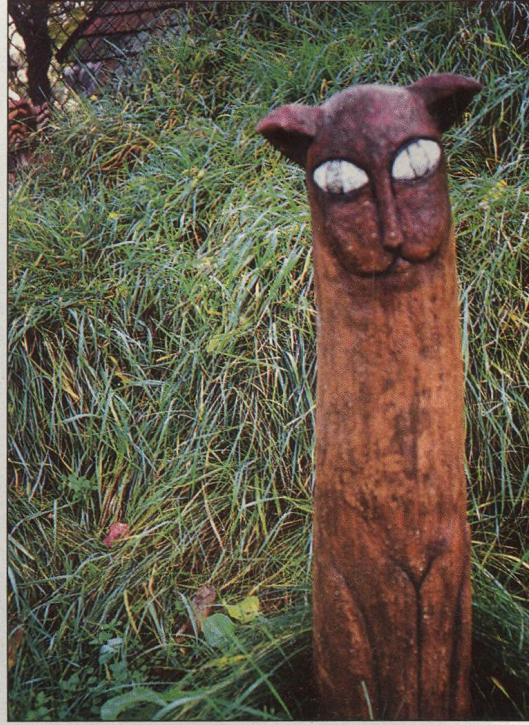
14 Na návštěvě