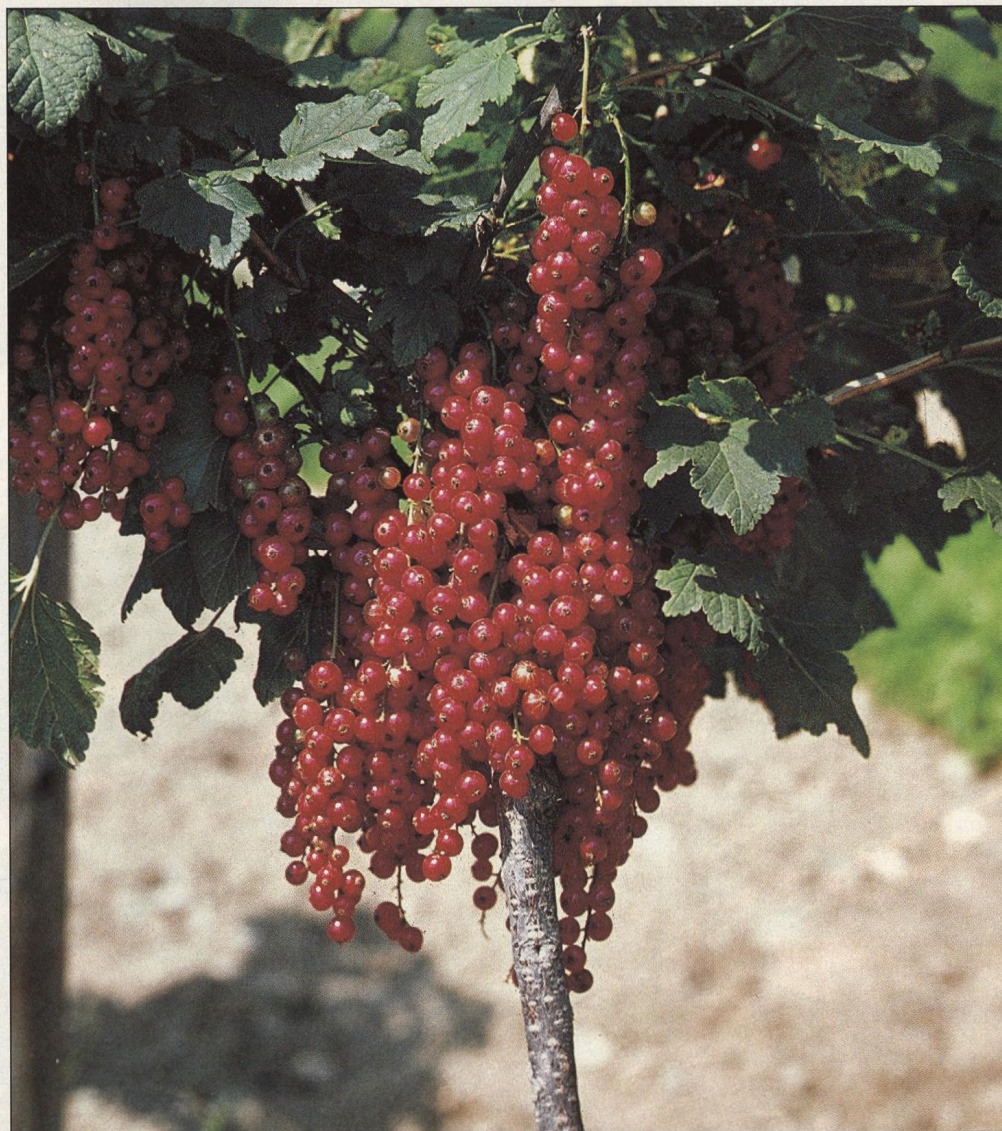
54 Stromkové tvary drobného ovoce