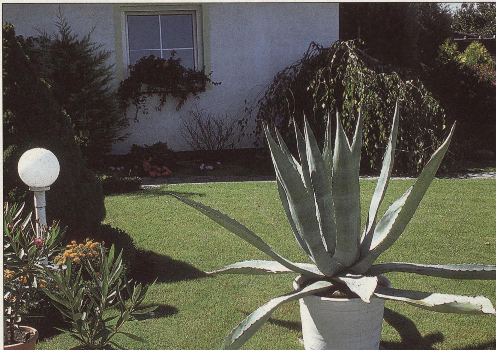
28 Agáve, od malých po obrovské