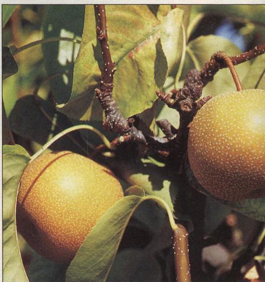
13 Znáte nashi?