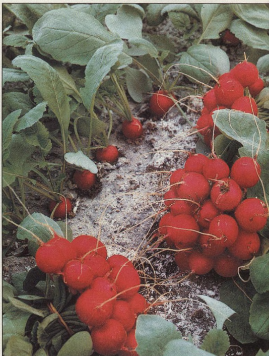
56 Skřízeň a využití rané zeleniny