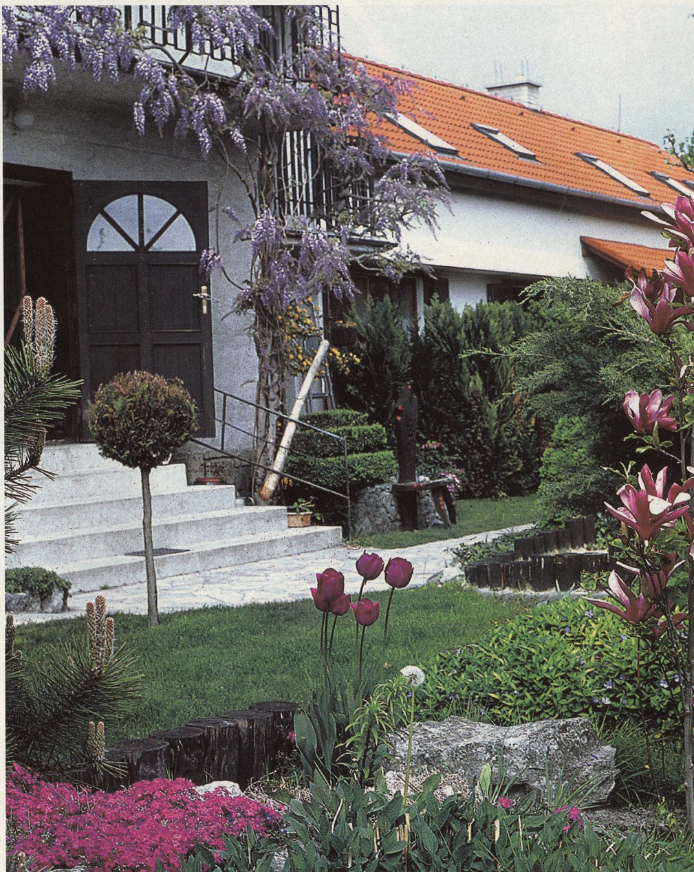
14 Pod rozkvetlou vistárií