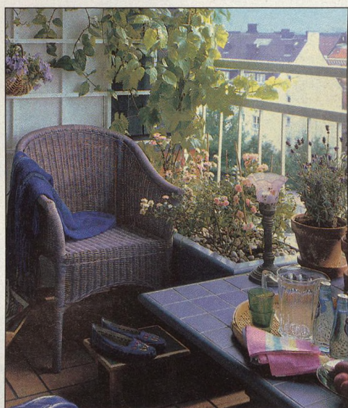
60 Posezení na balkóně