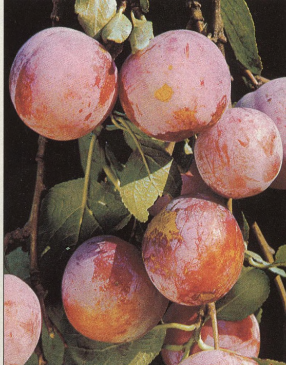
12 Nejhodnější termíny řezu ovocných dřevin