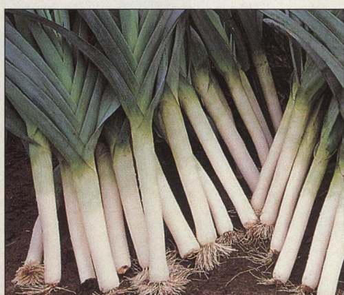
24 Pór na zahradě