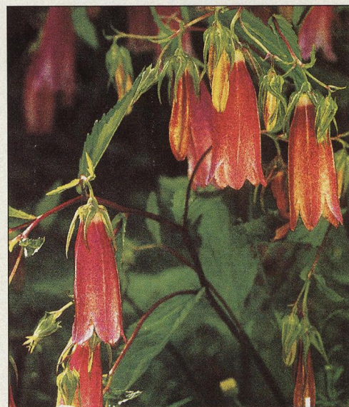
6 Zvoní nám k létu