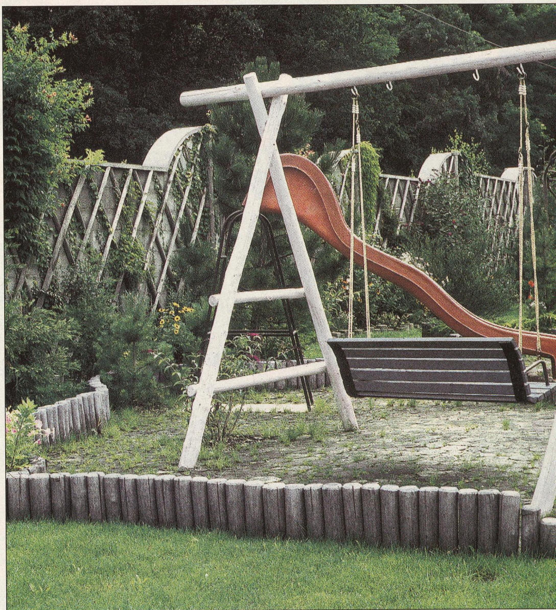
46 Trávník zvýrazní eleganci zahrady