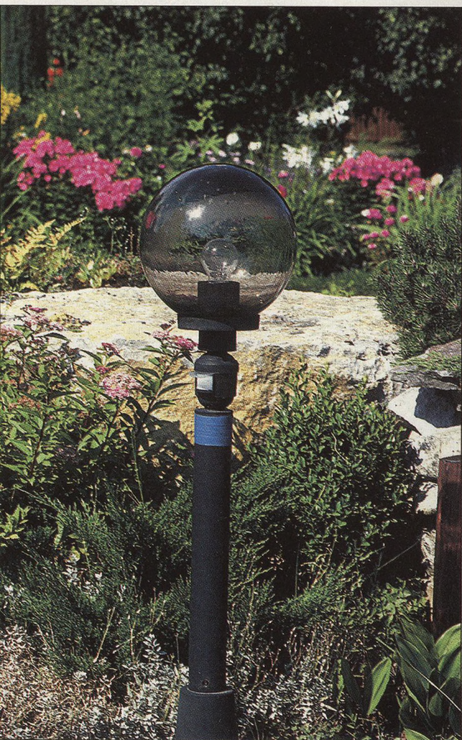
14 Proměna venkovské zahrady