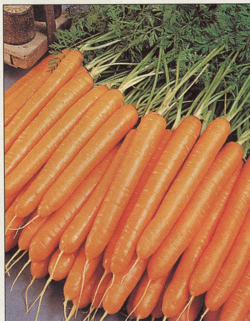
24 Uskladnění kořenové zeleniny