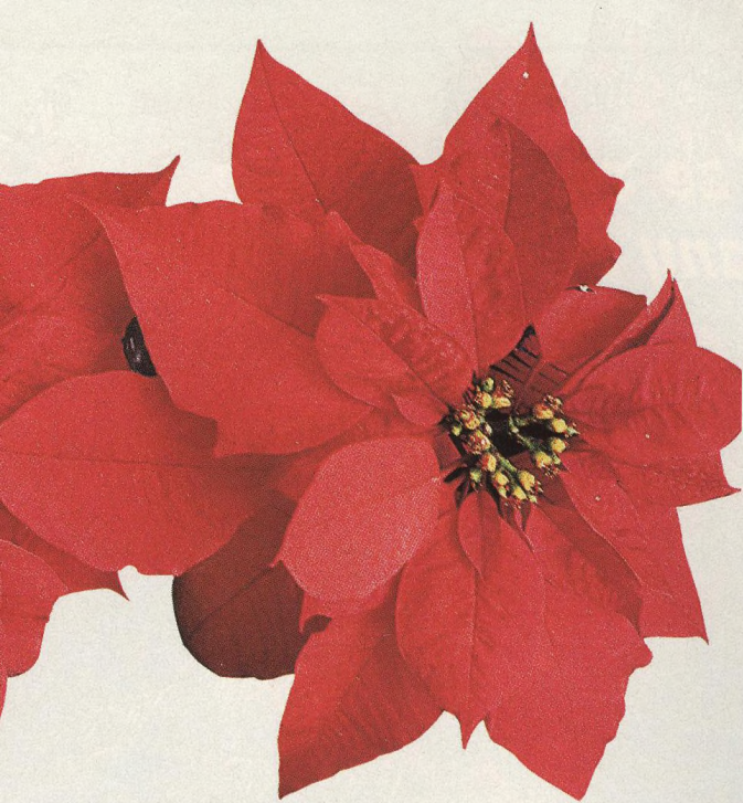
56 Kvetoucí pokojové rostliny a vegetační klid