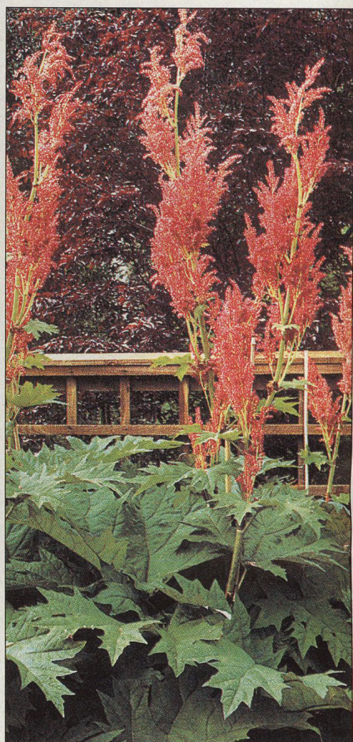
18 Vytrvalá rebarbora