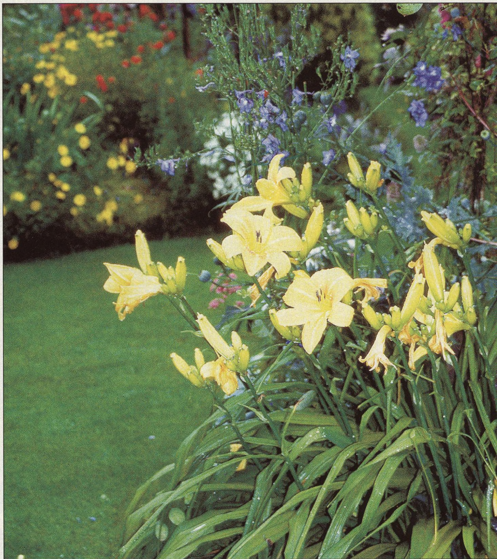
54 Všestranné trvalky