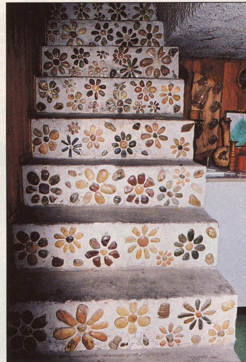
44 Malby z kamínek