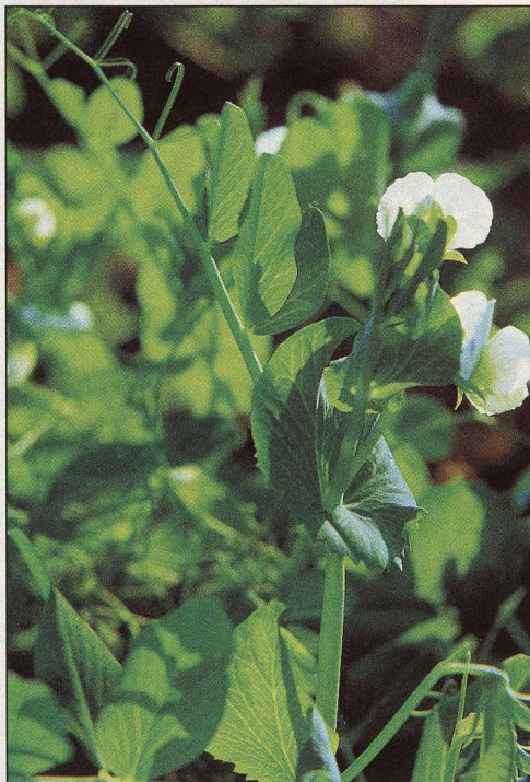
10 Sejeme ranou zeleninu