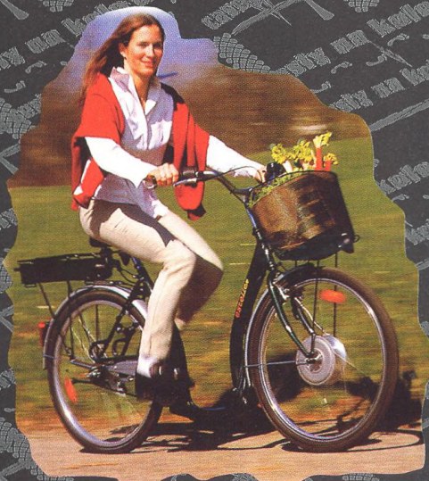
„E“ JAKO ELEKTROKOLO