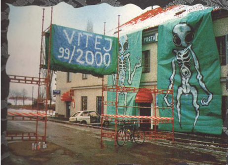
ROZKOŠNÁ NOVOROČNÍ DVOUSTOVKA OKOLO PRAHY