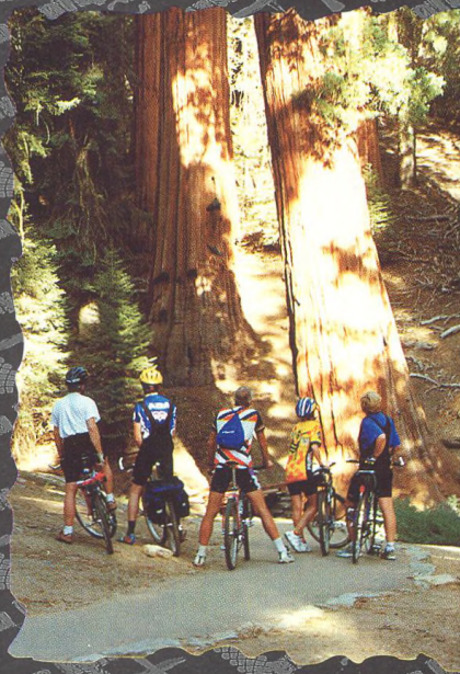
NÁRODNÍ PARKY AMERICKEHO JIHOZÁPADU