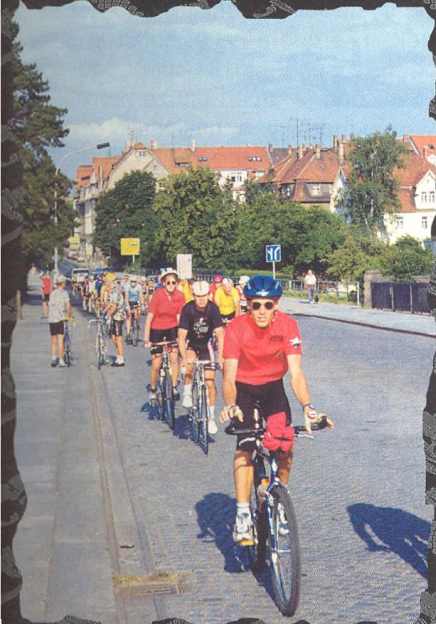
PŘÍLOHA 1/2000 KALENDAŘ CYKLOAKCÍ 2000