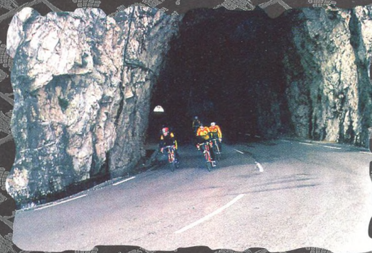
DOBYTÍ NEJVYŠŠÍ HORY MALLORKY