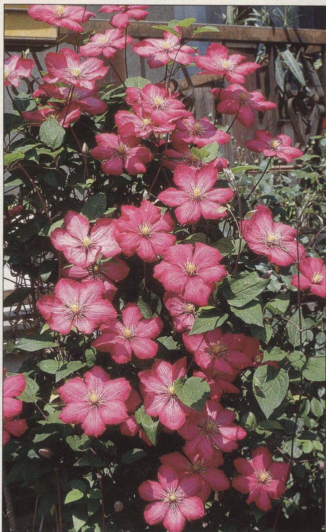
36 Pěstování popínavých rostlin