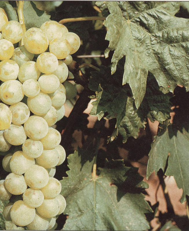
40 Stolní odrůdy vinné révy