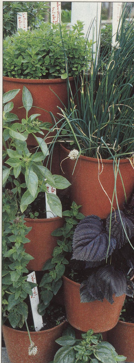
18 Sazenice léčivých rostlin