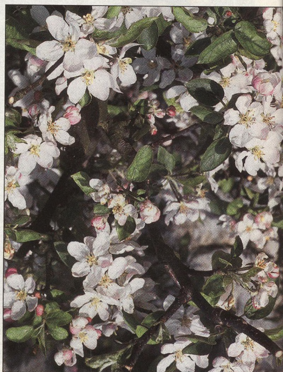
12 Opylování a oplodňování jaderovin