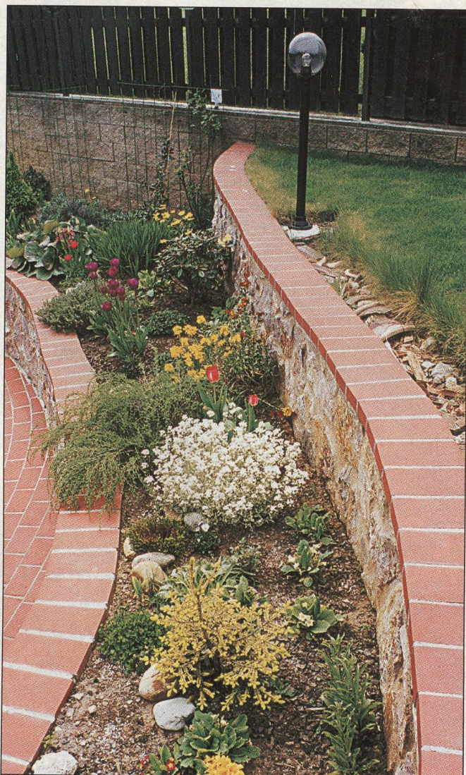
14 Zahrada ladných křivek