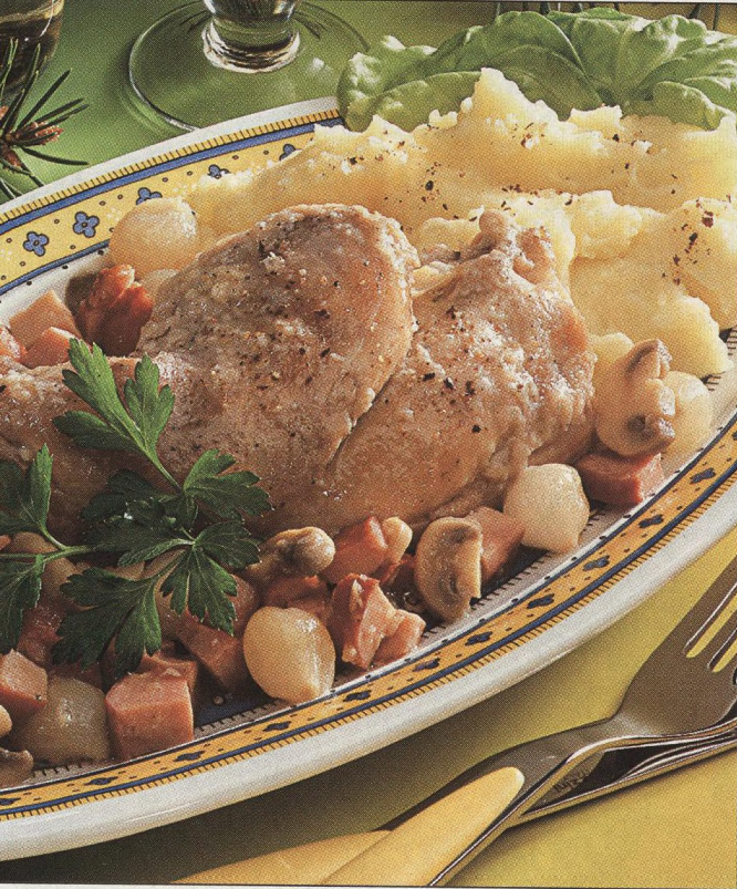
26 Králík na čtyři způsoby