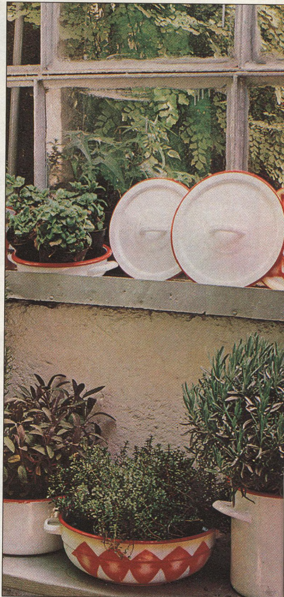
66 Neobvyklé vegetační nádoby