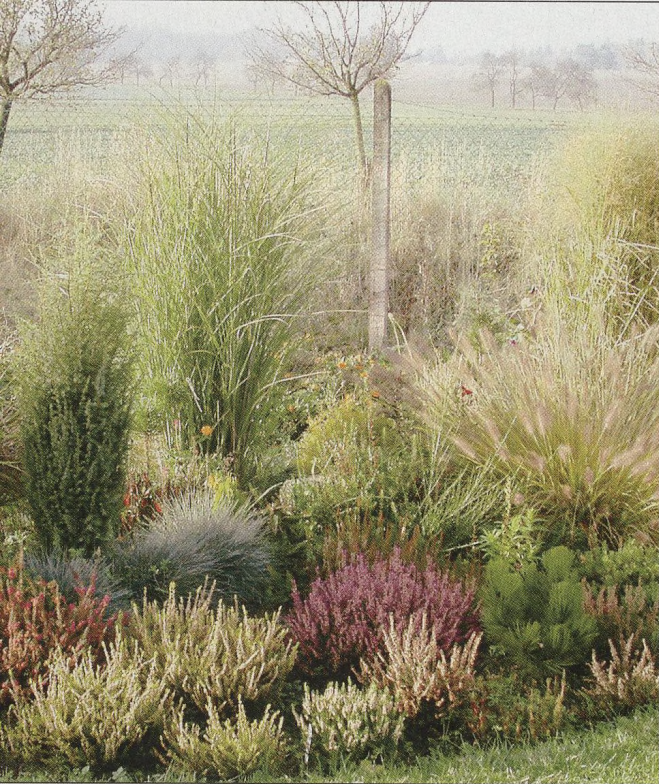
14 Zahrádka jako na dlani