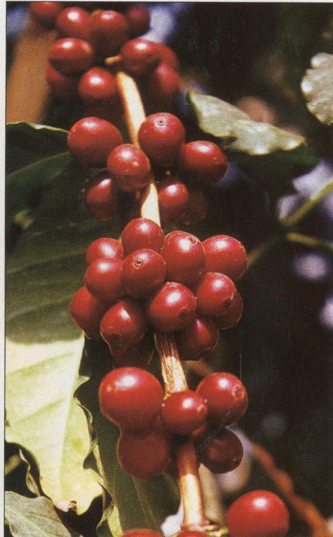
28 Cizokrajné pochutiny