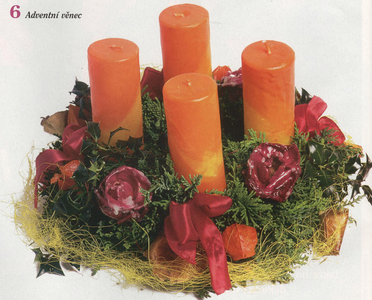
6 Adventní věnec