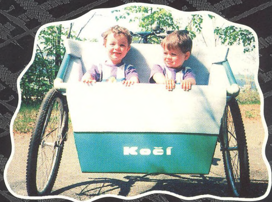
VÝLET PÁÁÁNY POSLANCI