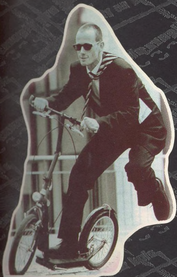
KOLOBĚŽKY PRO DOSPĚLÁKY