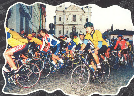
AUTHOR - KRÁL ŠUMAVY