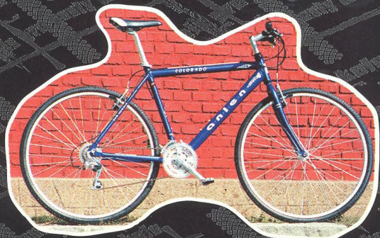
TEST KOLA ANLEN