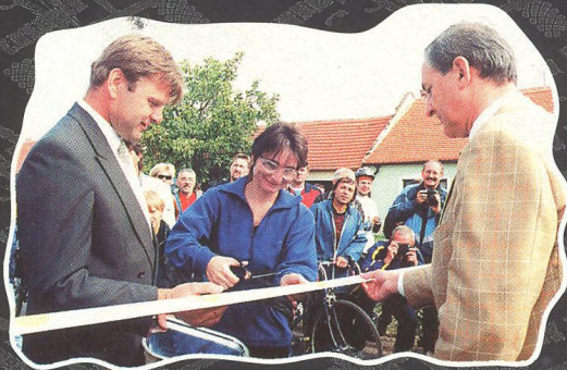
OTEVŘENÍ CYKLOTRASY BRNO - VÍDEŇ