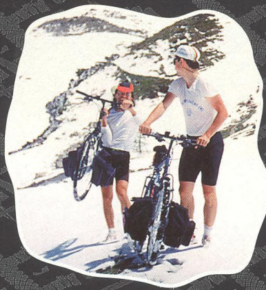
COL DE LA LOMBARDE