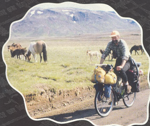
ZASTAVENÍ NA FAERSKÝCH OSTROVECH