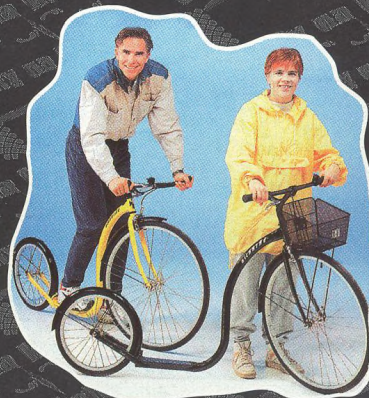
KOLOBĚŽKY PRO DOSPĚLÁKY