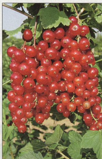
28 Nové odrůdy angreštu a rybízu