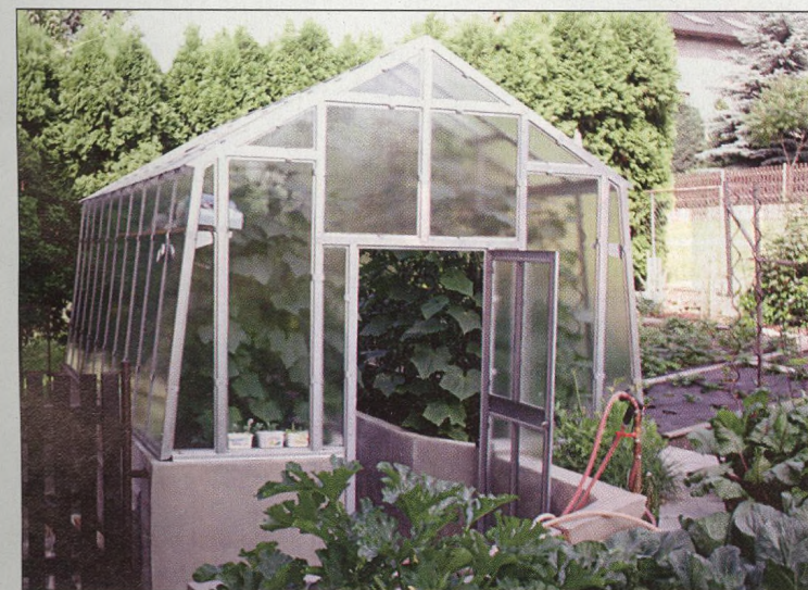
73 Pořizujete si skleník?