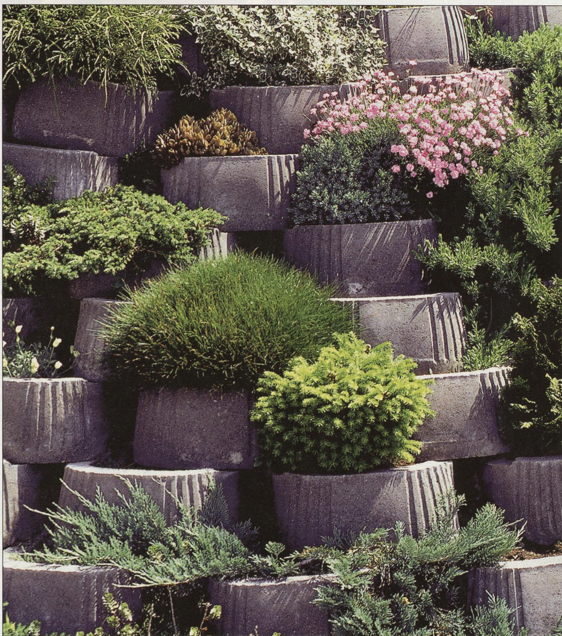
54 Terénní úpravy v zahradě