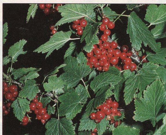
22 Vliv závlahy na úrodu ovoce