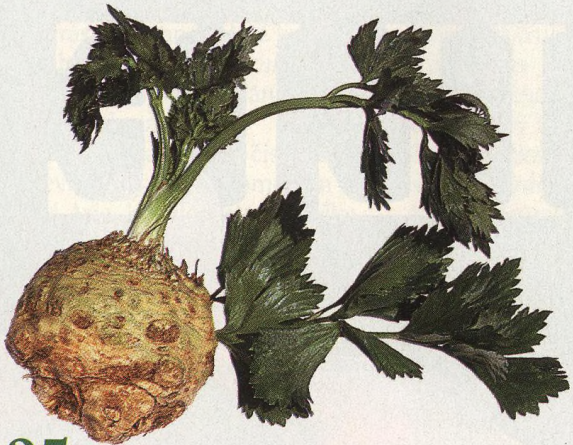
25 Chcete mít kvalitní celer?