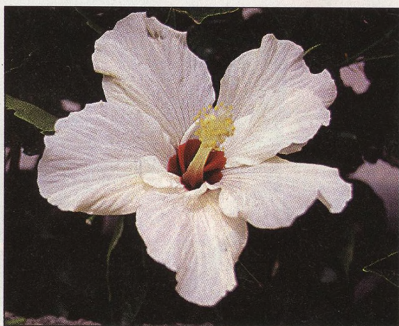
68 Bratrstvo čínské růže