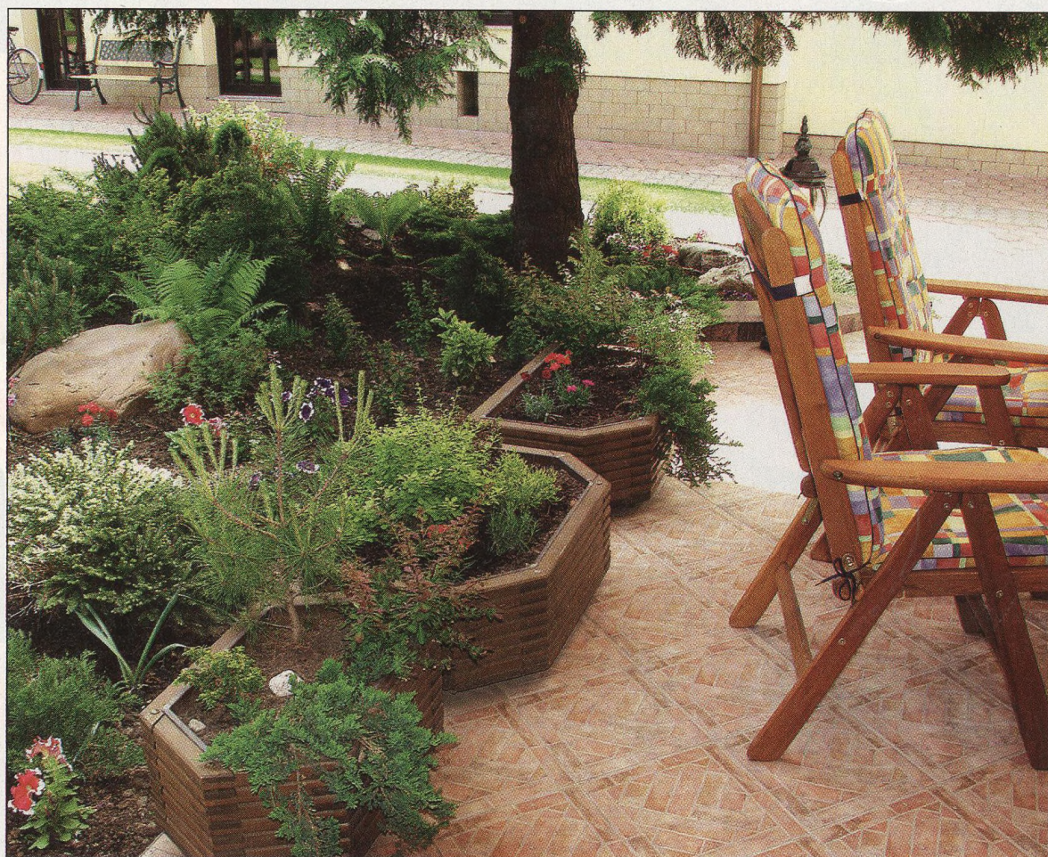
14 Kameny v zajetí zeleně