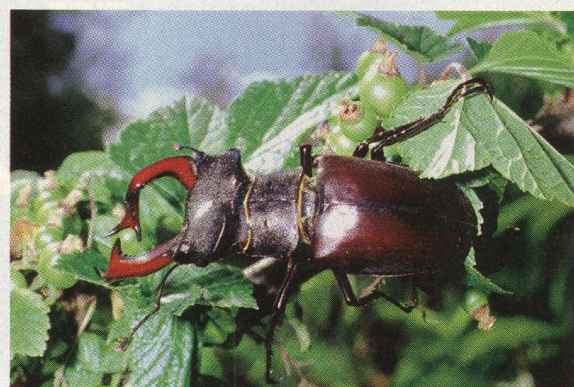
62 Rohatí brouci