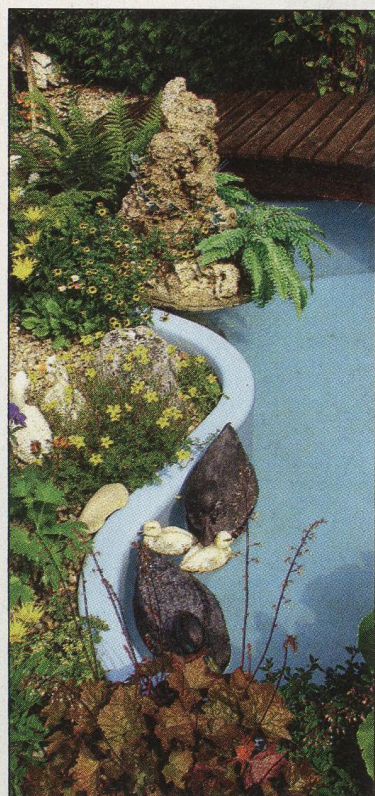
54 Zahradní jezírko