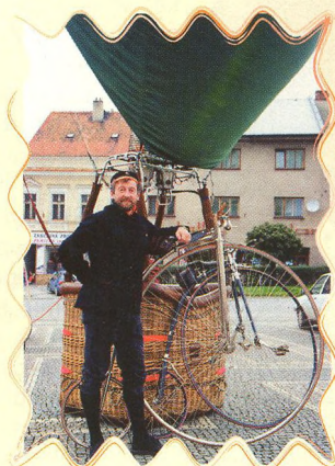
VELOCIPEDISTÉ NA OBLOZE 55