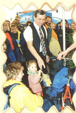
LOSOVÁNÍ ZÁJEZDU DO AMERIKY 15