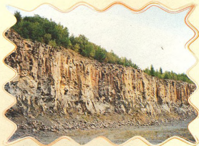
PŘES PĚT SOPEK 18 - 20