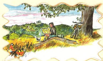
ZTRACENÉ HRADY HOSTÝNSKÝCH VRCHŮ 62 - 63