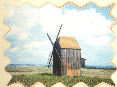
NA KOLE ZA VĚTRNÝMI MLÝNY 46 - 47