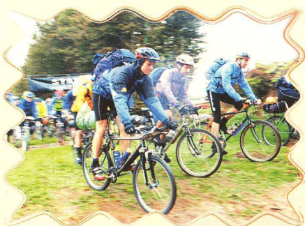
POLARIS CHALLENGE 32 - 35