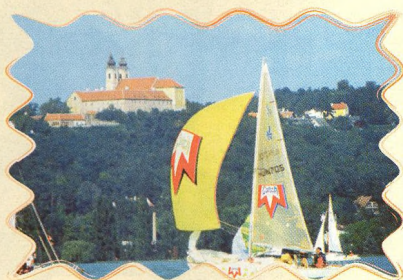
BALATON 26 - 28