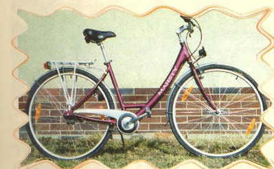
AUTHOR - MAJESTY 49